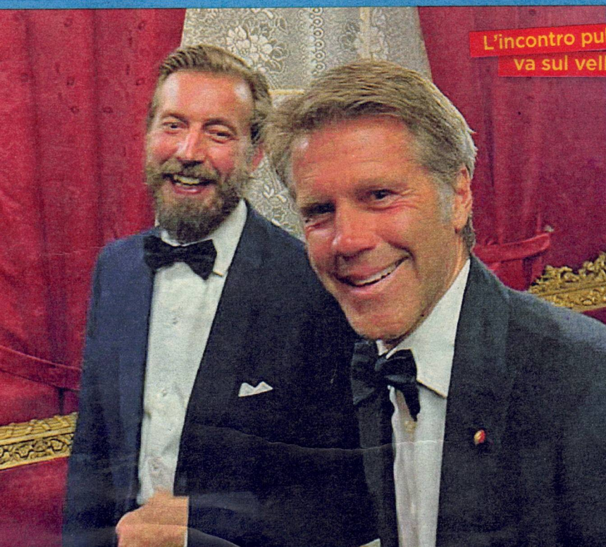
L'incontro pubblico va sul velluto

QUESTO NON CI IMPEDISCE DI AVERE RAPPORTI NORMALI», DICE IL FIGLIO DEL DUCA AMEDEO